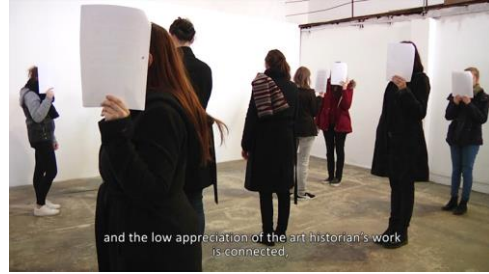
I 68 – video Kapelová