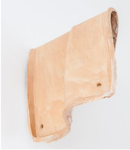
I 67 Kyša