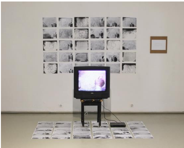
I 73 Bartusz