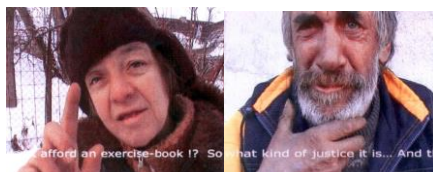
I 40 - video Fichta Čierna