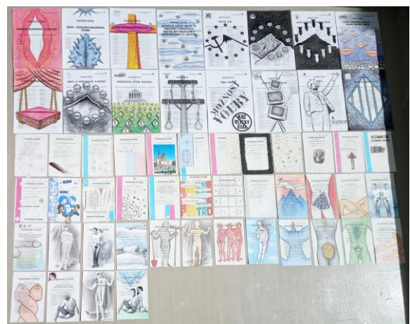
I 77 Filová