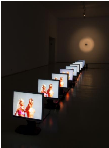
I 72 Meluzin