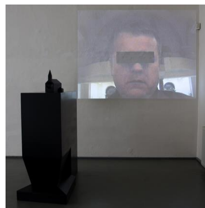
I 50 Čierny