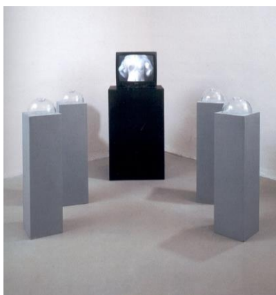
I 10 Želibská