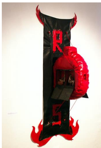
I 5 Ondreička