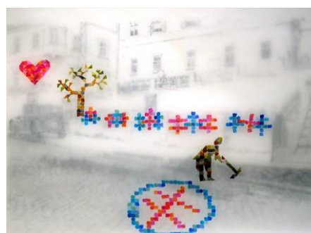
I 66 Krajčová