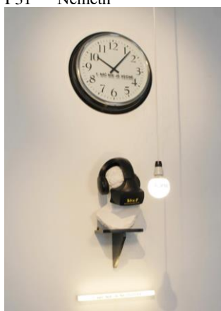
I 63 Galovský