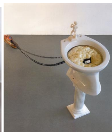
I 30 Rónai