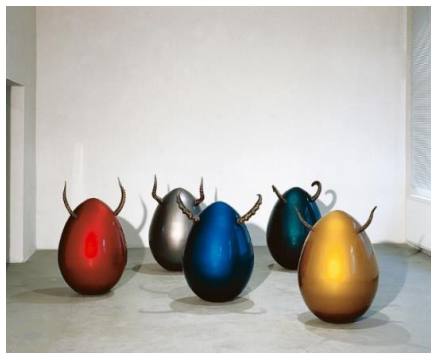
I 8 Teren